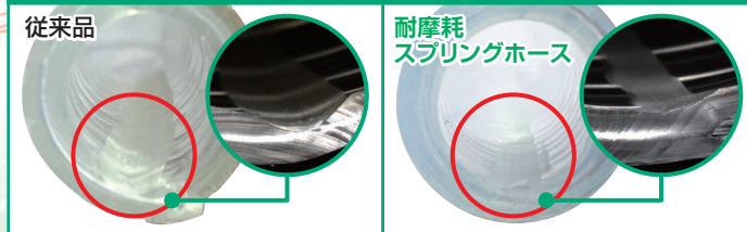
試験方法:ヤスリ(上目58)を1秒=1回の速度で前後1000回、75mm移動させて試料ホース内面を摩耗させる。