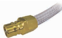
カップリングMEGAタッチ

MEGAタッチとプラグが一体化。 配管接続の変更に便利。 材質:SUS304、BsBM(真鍮製)